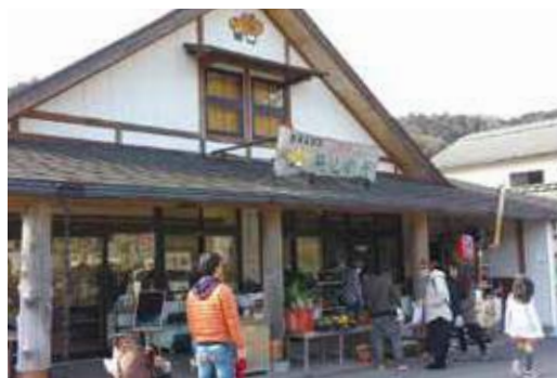
de愛・ほっこり見山の郷