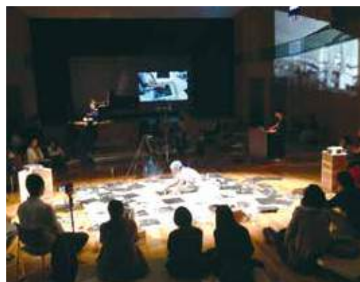
若手芸術家育成事業