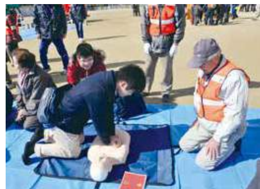
地域での防災訓練(救命訓練)