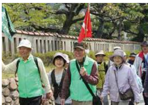
老人クラブのハイキング