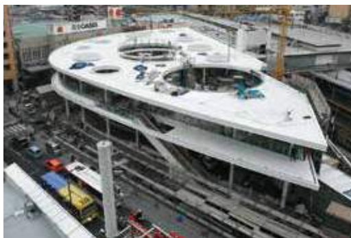
JR茨木駅東口駅前広場 (H27.2)

さらに、彩都における研究開発機能の集積や大学立地、交通利便性といったポテンシャルをいかし、人材の育成や企業立地を推進し、雇用機会の拡大と経済の活性化を図ります。