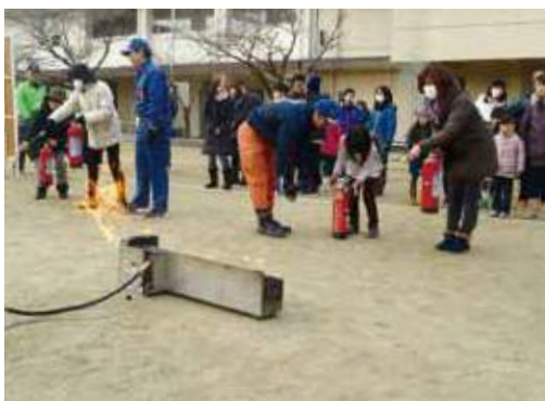
地域での防災訓練(初期消火訓練)