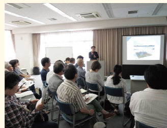
まちづくり勉強会

ワークショップと並行して、「いばらきひろばトーク~場の活用によるまちづくり勉強会~」を実施しています。各地で、場の活用や空間の魅力を高める取組を行っておられる方々を講師としてお招きし、活用事例や社会実験を実施するにあたっての秘訣などをレクチャーいただいています。