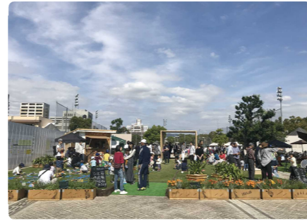
2018年社会実験の様子

今年は、そんな空間を何気なく行き来している「まちなか」にも増やすことを目的として、「IBALAB plus(イバラボ プラス)」と名づけた取組の検討を進めています。「IBALAB plus」では、実際にみんなでまちを歩きながら空間やスポットを探し出し、その魅力を高める使い方を考え、社会実験として実施していきます。