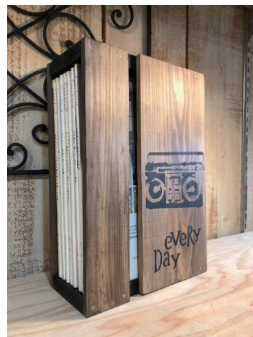
※写真は完成例です。 ※おおよその外寸 (mm) …W110 D225 H380