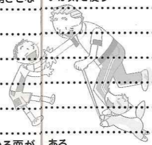
（2007年第一生命経済研究所「子育て世代のワーク・ライフ・バランスと祖父母力」より）

どもたちに劣らないような豊かな生活をさせることが、祖父母にとっては生きがいになる場合もあります。