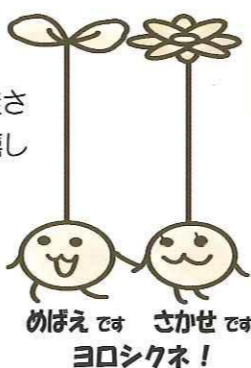
めばえでさ さかせでさ ヨロシクネ！