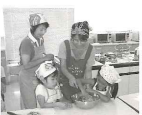
はじめてのギ ョーザ作り。 思ったよりき れいな形に包 めました。 おいしそうで したよ。