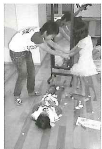
「ピッツアばうや」 のお話の世界で、ピツ ツアに変身できまし たか？

当日はローズWAM市民ボランティア・登録団体・市民サークルに加え、府立北摂つばさ高校の生徒さん もパーク運営にご協力くださいました。子どもたちのたくさんの笑顔に出会うことができ、とても嬉し く思います。