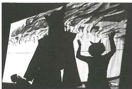
みんなはえんまさまにごあい さつができたかな？ いばらきはよい子ばかりで、 えんまさまもビックリしてい ましたよ。 こんどはいつえんまさまに会 えるか、楽しみにしててね。