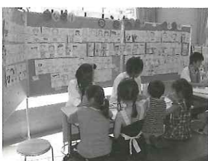
世界のお友達と、 きつとどこかで つながっているね。