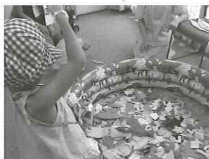
「あそぼ」のお部 屋からは歓声が！ 「ママ見て！お魚 が釣れたよ！」