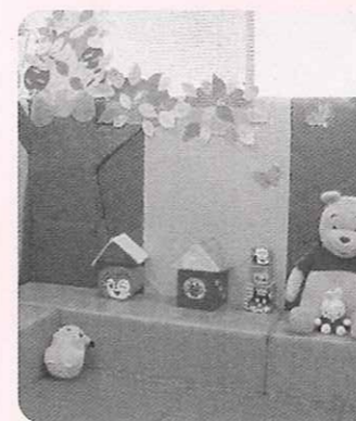
チャイルドスペースや授乳室も完備。

マザーズハローワーク烏丸御池 ・京都市中京区烏丸御池上ル 明治安田生命京都ビル1階 TEL075-222-8609