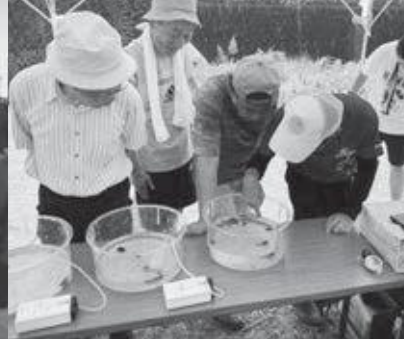
川の生きもの探検(福井公民館)