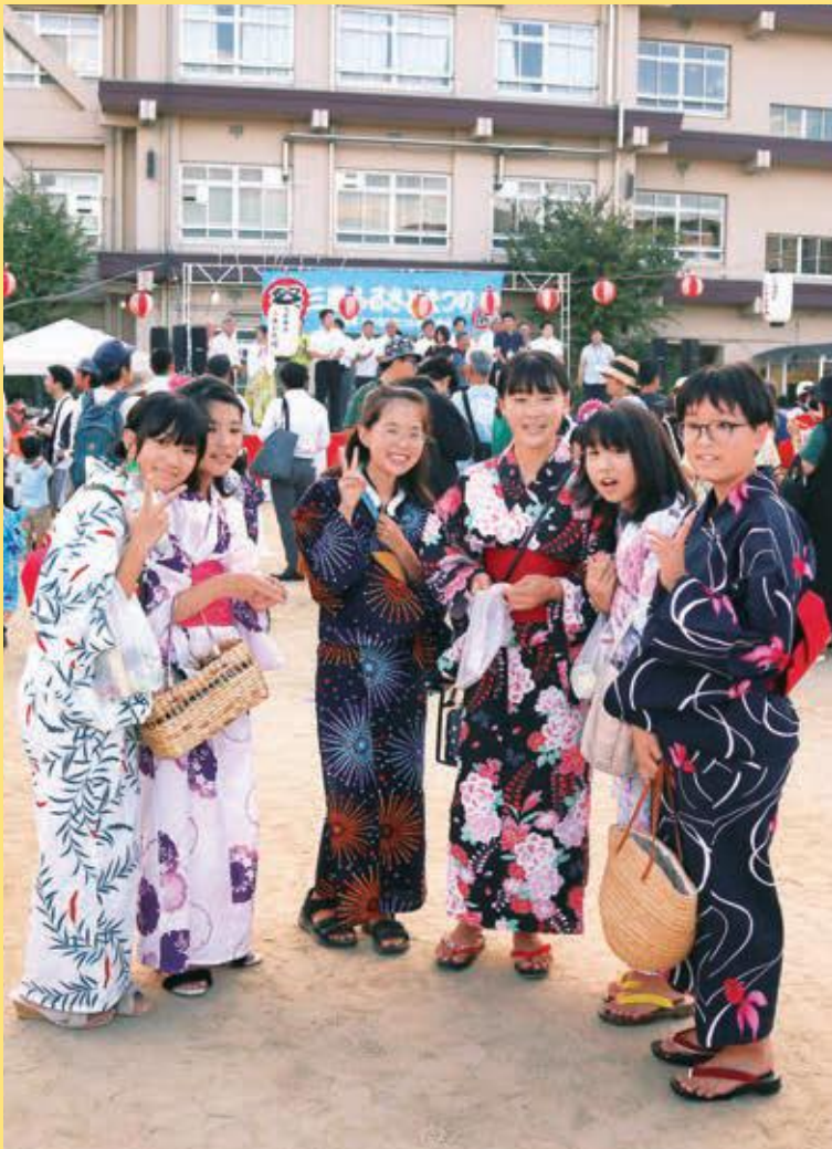
ふるさとまつり(三島小学校区)