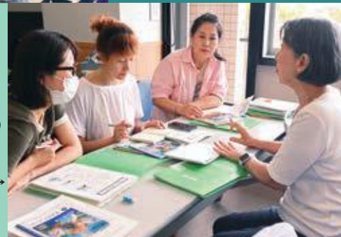
日本語読み書き学級(中央公民館)→