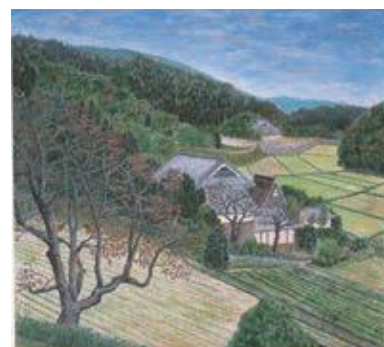
「柿のある里山」(茨木・銭原)

生涯学習センターのきらめき講座で「日本画」を受講していました。こどものころから絵を見たりデッサンを描いたりするのが好きでした。美術展や仲間内の展覧会に出展しています。描いた絵は見てもらって自慢したくなるものです。自分に対して何かを課すというのは刺激になりますし、大事なことだと思います。