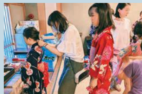
子ども達に浴衣の着付け(大池小学校)

意し、子どもたちに着付けをすることになりました。小学校の和室を使い、着付け教室の先生をはじめ数名で浴衣を着せていきます。髪飾りを作る人もいて、かわいいリボンをつけてもらいます。祭りが始まれば、子どもたちはここにこしながら連れだって広場へと向かいました。子どもたちにとってはいい思い出になるでしょう。来年は男児用も準備するそうです。