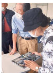
「パソコンやスマホの半導体を観察しよう」

今まで学んできた知識や技術を生かして「こんな講座をやりたい」という講師からの申し込みで開かれる講座です。