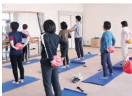
「ボディリフレッシュ」