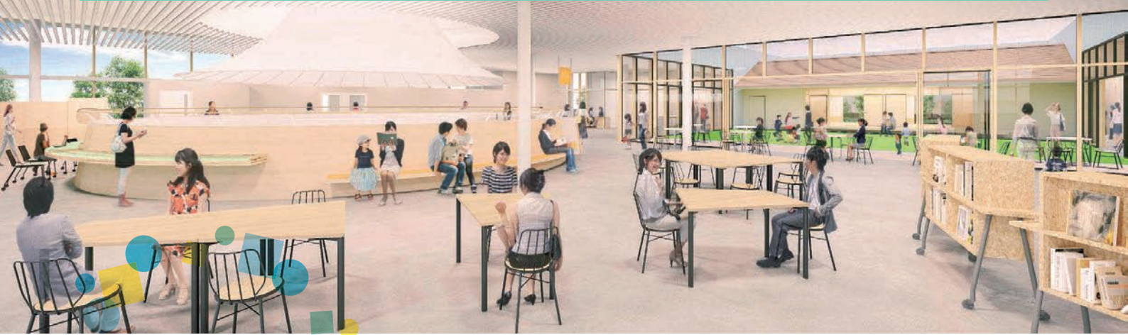
「おにクル」7F「市民活動センター」前のイメージ

市民の皆様の参加・参画により、一層の推進を図りたい事業について、この特集ページで取り上げています。今回は新施設「おにクル」に入る「市民活動センター」の特集です。