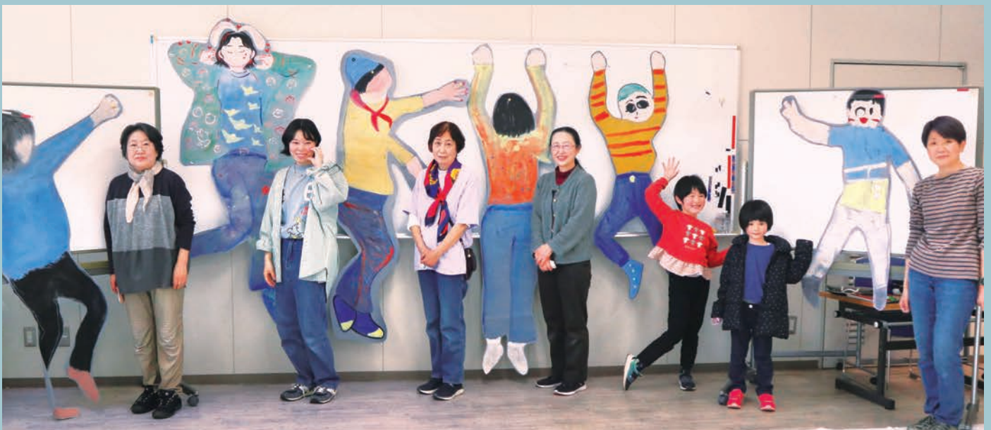
きらめきフェスタ(2023.3)「自画像を描いてみよう!」講師と参加者