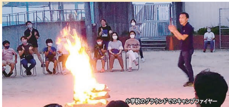
小学校のグラウンドでのキャンプファイヤー

自然の中、みんなでご飯を作って食べるのも楽しいのですが、真っ暗な中、炎の明かりだけで何かをやるという非日常的なことが貴重な体験になります。だんだんと暗くなっていく中でファイヤーを囲んで炎を見つめ、歌やゲーム、踊りなどをします。初めは戸惑っていた子どももだんだん夢中になり、最後は生き生きとして歌ったり