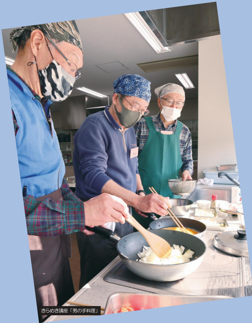
きらめき講座「男の手料理」

生涯学習センターきらめき主催講座など 人権・平和 防災・安全 福祉 健康・暮らし 子育て・教育 自然・環境 産業・仕事・観光 歴史・文化 スポーツ・レクリエーション