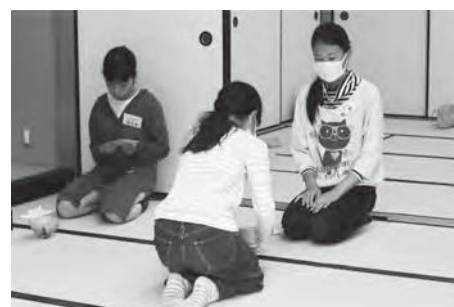
きらめき特別講座「ジュニアのための伝統文化茶道講座」