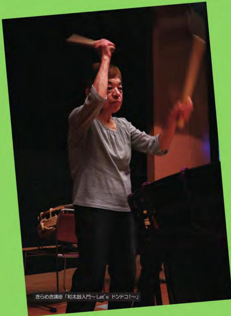
きらめき講座「和太鼓入門～Let's ドンドコ!～」

生涯学習センターきらめき主催講座など 人権・平和 防災・安全 福祉 健康・暮らし 子育て・教育 自然・環境 産業・仕事・観光 歴史・文化 スポーツ・レクリエーション