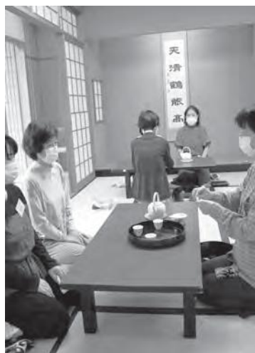
きらめき講座「趣味と作法 煎茶講座」