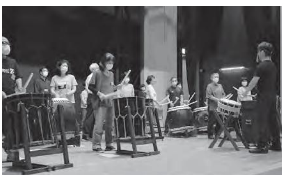
きらめき講座「和太鼓入門~Let's ドンドコ!」