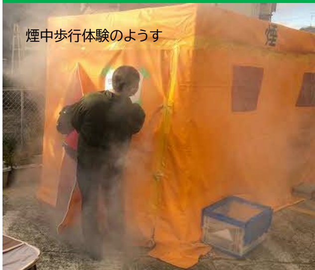
煙中歩行体験の様子