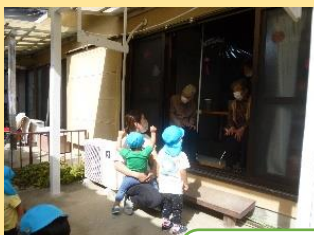
デイ日向のおじいちゃんおばあちゃんに 会いにいったよ！