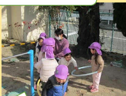
お外で元気に電車ごっこ。 上手く出発できるかな？