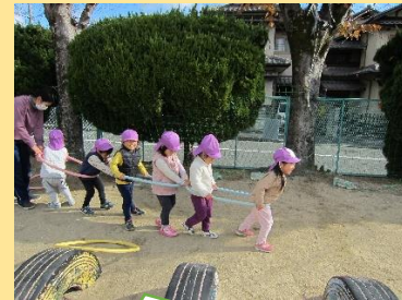
できたできた！出発進行！