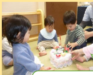
1歳のお誕生日おめでとう！ みんなと一緒に嬉しいね。

総持寺保育所では「であい ふれあい そだちあい」をテーマに一人一人を大切にする保育を目指しています。いろいろな人や物との出会いや地域とのつながりを通して、豊かな心や自分や友だちを大切に思える心を育んでいきたいと思ひます。