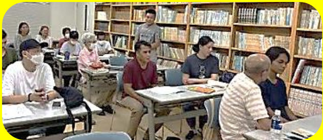
識字・日本語教室の様子