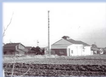
センター建設前(旧石塚温泉)