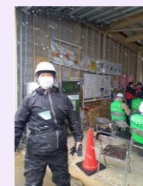
(珠洲市ボラセンにて)

地震や大雨など、自然災害は時として想像をはるかに超える力で襲ってきます。平時から避難経路の確認や非常食・水の備蓄など、いざという時に備えて準備しておきましょう。(※総持寺いのち・愛・ゆめセンターは指定避難所です。)