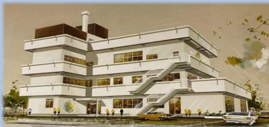
1974年 当時の竣工図(センター外観)

1974(昭和49)年に「解放会館」の名称で「総持寺いのち・愛・ゆめセンター」が開設され、部落差別をはじめとするあらゆる人権問題への啓発や地域交流事業を行ってきました。8年後の1982(昭和57)年には「青少年会館」の名称で別館が開設。現在、「ユースプラザ」および「い」による若者の居場所事業等が実施されています。それから様々な変遷を経てきましたが、開館当初から変わらぬのは地域に根差した活動拠点であり居場所であるということです。皆さまとのつながりを大切に、未来に向けて歩んでいきます。これからもどうぞよろしくお願ひします。