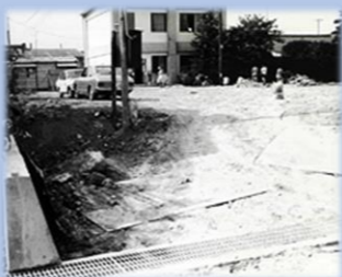
本館 造成工事の様子