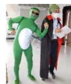
10月のツドイバ「にほんごカーニバル」のようす

★「THU DO I BA(ツドイバ)」では、みんなであつまって日本や世界の文化を体験しました。