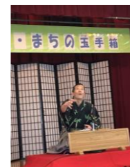
昨年開催時の様子(展示・舞台)