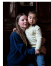
写真：ウクライナから避難している親子 (ワルシャワで3月17日)

茨木市在住の写真家『小原一真さん』ポーランドで取材されたウクライナ難民の方々の現状などをお伝えします。