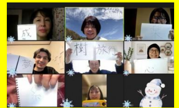
(写真は前回開催時の様子)

毎月第2水曜日はインターネットをつかった多文化交流会。 今年度1回目は5月8日(水)、 テーマはなんと「大阪弁！！」 外国人の方にはちょっと難しい 大阪弁の使い方についてみんな でワイワイ勉強しましたでー。