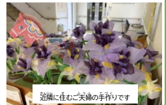
近隣に住むご夫婦の手作りです