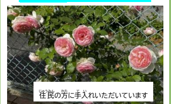
雀籠の方に手入れいただいています