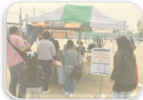
(三島中学校グラウンドで)