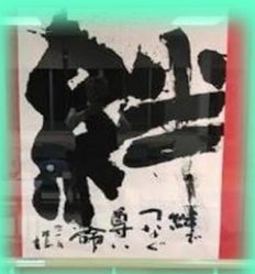
昨年のヒューマンワード 大賞/「絆でつなぐ尊い命」

今年印象に残った人権にかかわるテーマやキーワード、文字など20字以内で応募してください。 入選作品は、来年2月15日(土)の「みしままちの玉手箱」で表彰します。(11/20 締切 総持寺愛センターまで)