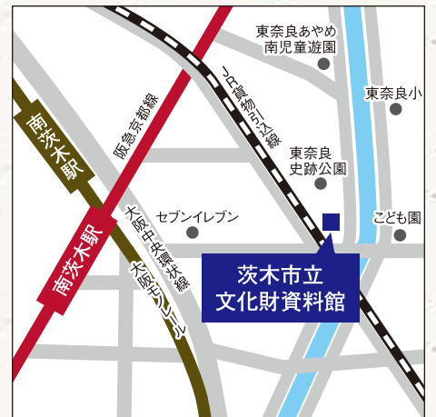
● 阪急・大阪モノレール「南茨木駅」から東へ300m