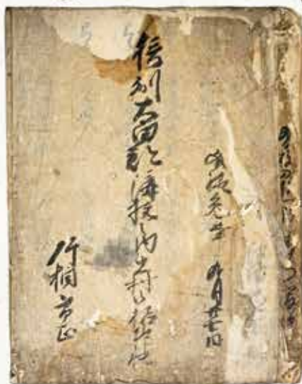
文禄3年(1594年)検地帳(十一村・本中村家文書)