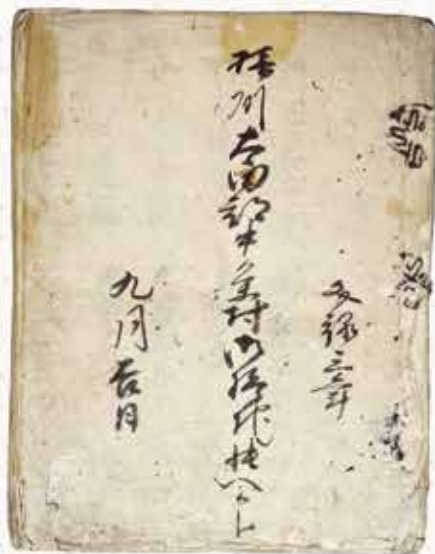
文禄3年(1594年)検地帳(中条村(信賀分)森脇家文書)

当館が開館以来この40年で収集してきた資料や、地域の伝承を集めて、豊臣秀吉と茨木の歴史をひもときます。