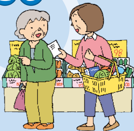
生活必需品の買物の同行