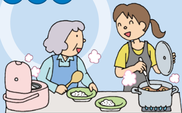
利用者と一緒に調理

介護保険法の目指すサービスとは、利用者の「自立した日常生活」を営むことができるように、また、その家族の負担を軽減させるために必要な支援を行うことです。