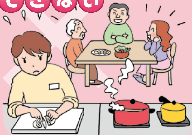
利用者以外のための家事