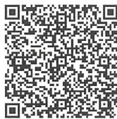
<いばらきオレンジカフェ>