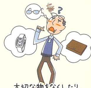
大切な物をなくしたり、置き忘れたりする