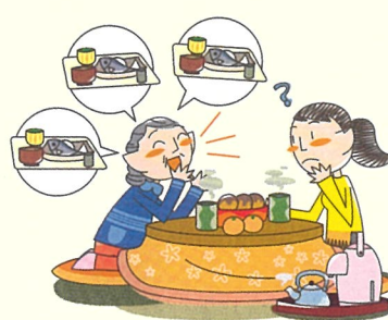
何度も同じことを言う、聞く