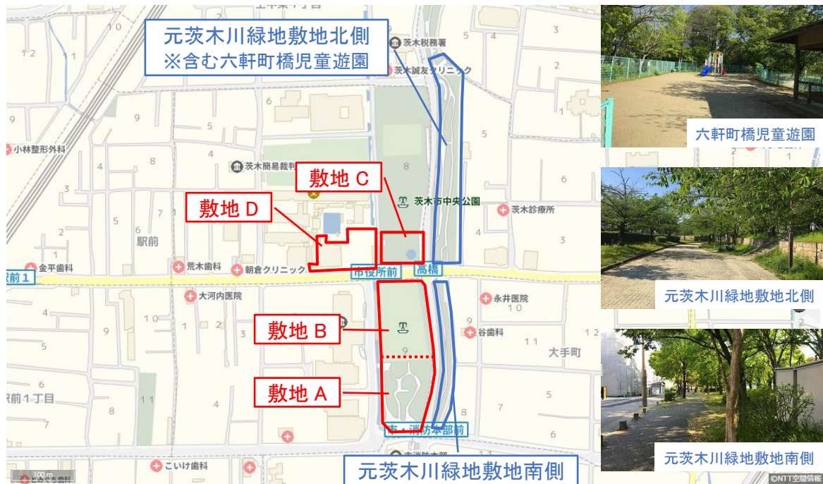
図 2.1.PPP 手法導入想定範囲