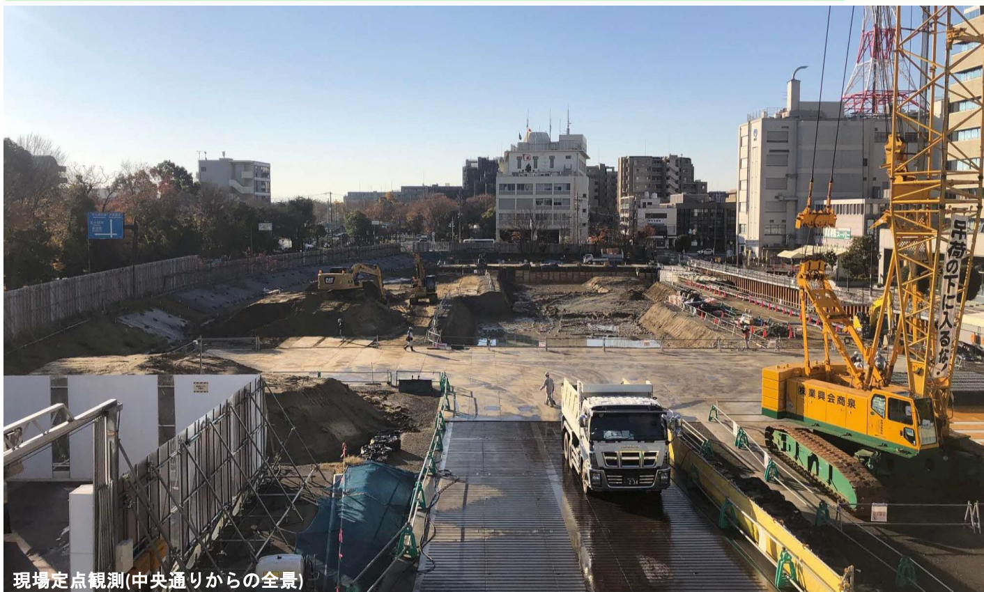
現場定点観測(中央通りからの全景)