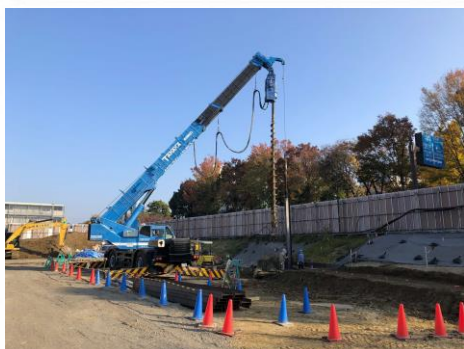
掘削するために山留杭を設置しています。