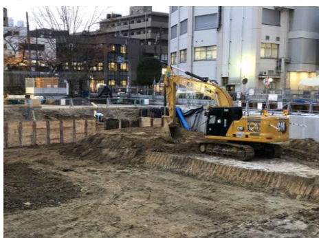
建物の基礎をつくるために土を掘っています。