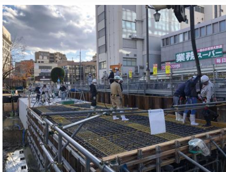
新しい水路を作っています。