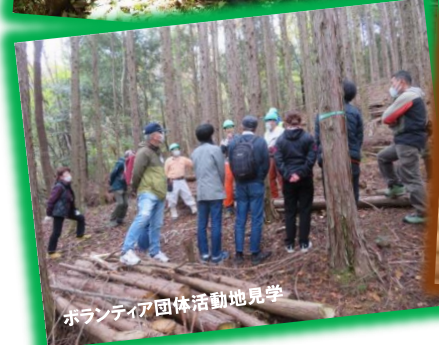
ボランティア団体活動地見学

20代女性 遊び場としてお世話になっ てきた森や山のことをちゃんと 知りたい、支えになる活動を したいという気持ちで参加。 年齢を問わず、素敵な出会 いもありました。