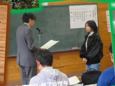
閉講式 認定証・終了証授与

20代女性 遊び場としてお世話になっ てきた森や山のことをちゃんと 知りたい、支えになる活動を したいという気持ちで参加。 年齢を問わず、素敵な出会 いもありました。