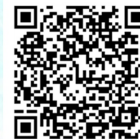
↑新施設予約システムについてはこちらから

なお、空き照会はどなたでも可能ですが、ネット予約のご利用には事前の利用登録申請が必要となります。