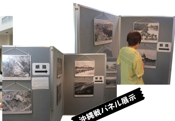
沖縄戦パネル展示