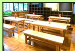
すてきなカフェルーム で楽しい交流を

M a i l : h - p e r c h @ h o p e . z a q . n e . j p