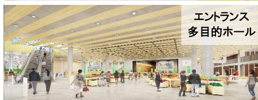
エントランス 多目的ホール