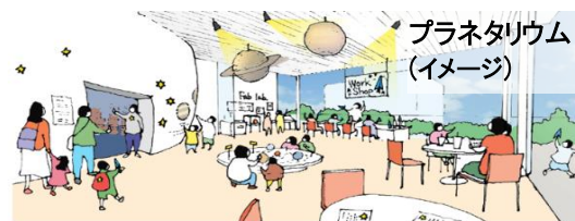
プラネタリウム (イメージ)