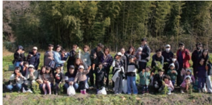
にんじん収穫体験の様子