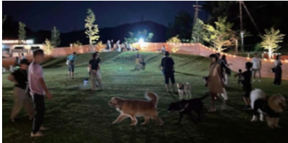
ナイトドッグランの様子