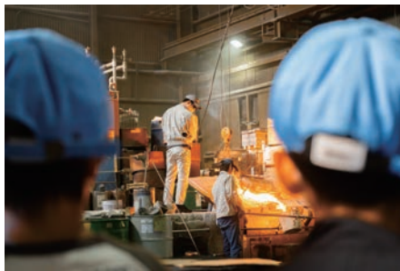
昨年のオープンカンパニーの様子

【 時 】 6月18日（木）14時から、7月2日（木）10時から 【 所 】 ローズWAM501・502 【 対 】 市内企業 【 内 】 オープンカンパニー参加に向けた案内 【 申 】 各前日15時までに 【 W 】 で 【 内 】 産業振興課 620・1620