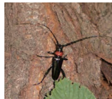
クビアカツヤカミキリ

クビアカツヤカミキリは、幼虫がサクラ、ウメ、モモ、スモモ等、バラ科の木の内部を食害し、枯死させる特定外来生物です。今年初めて市内で被害を確認しました。成虫を見つけたらその場で踏みつぶして駆除し、お知らせください。また、サクラ等の幹や根元でうどん状の木くず（フラス）を見つけたらお知らせください。問 環境政策課 ☎ 620・1644