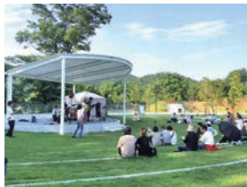
屋根付きステージ