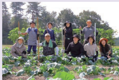
就農支援塾あぐりば

時 1/22(木)14:00〜16:00(雨天中止) 所 スギ薬局駅前通り店(駅前四丁目2-28) 内 新規就農者等による茨木産の新鮮な野菜等の販売(売り切れ次第終了) 問 農林課 ☎ 620・1622