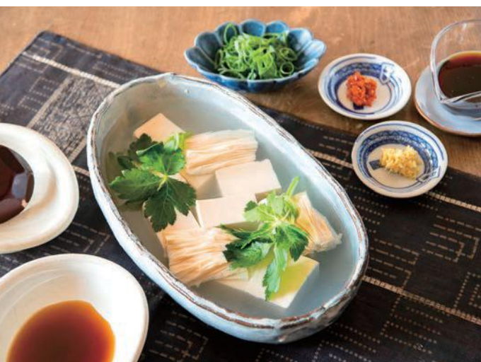
生とうふ 絹と手造り湯葉(伏見屋)