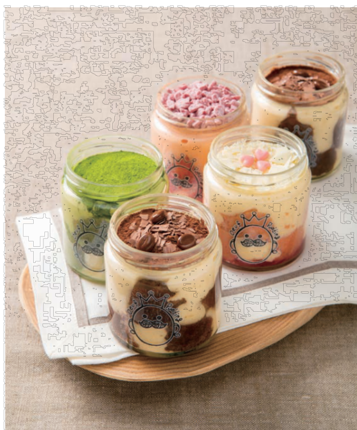
プリンとティラミスを組み合わせた「ティラプリ®」が一番人気(写真手前)