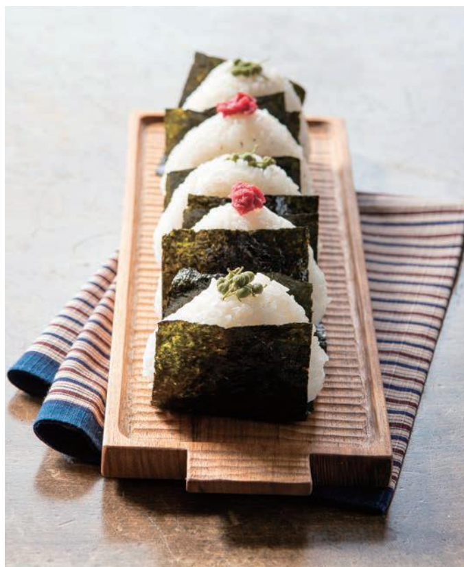
青実山椒佃煮(小倉屋松柏)、味付け海苔(海苔のひさご)

あり、ラインナップを見るだけでも楽しめます。 まずはこの年末年始から、気になるものを試してみてもいい。市外の人たちもうらやむ茨木名物に囲まれた暮らしができるのは、市民ならではの特権です。友人や親せきにもぜひおすすめを。茨木でがんばる店や生産者、会社などの事業者の応援にもつながります。