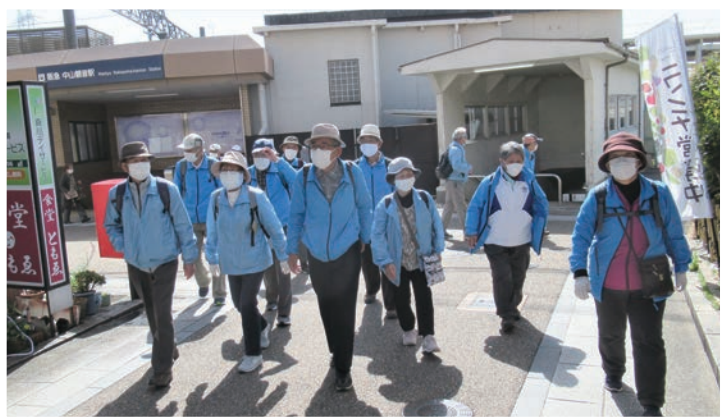
ウォーキングチームの活動の様子