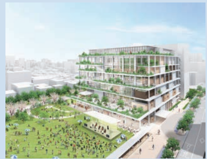
市民会館跡地エリア新施設イメージパース

時5/20(木)~6/18(金)、8:45~17:15 (土・日曜日は休館)、 所 市役所南館9階市民ギャラリー、 内 市民会館跡地エリアの設計を行っている伊東豊雄建築設計事務所がこれまでに手掛けた公共建築を例に、さまざまな視点から公共建築の意義やこれからのあるべき姿、そして本市に整備される新施設を考える展示、 閩 市民会館跡地活用推進課 ☎ 655・2757