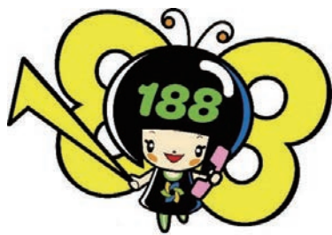
イメージキャラクター イヤヤン

悪質商法等による被害等のトラブルで困っていることはありませんか。そんなときは1人で悩まずにご相談ください。専門の相談員がトラブル解決を支援します。【問】消費生活