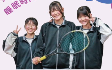
平田中学校女子テニス部の皆さん