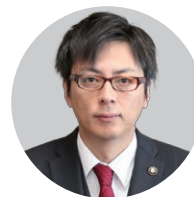
茨木市長 福岡洋一

この市勢要覧は、未来を見つめ、さらなる成長を遂げようとする茨木市の姿を紹介しています。市政へのご理解をいただくうえでお役にたていただければ幸いです。