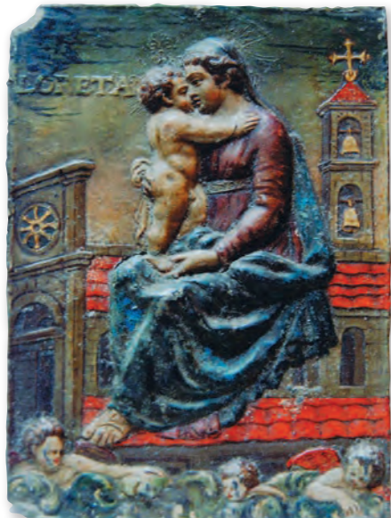
ロレータ聖母子像 (市指定文化財)

聖母マリアと幼いキリストが描かれた「ロレータ聖母子像」(右)は 鋳造製。当時の色が今も鮮やかに残る。 聖母マリアとキリストの15のエピソードが周囲に配された「マリア十五玄義図」(左)。中央右下にザビエルがいる。千提寺・下音羽では、そっくりな「マリア十五玄義図」が2枚発見されているが、一部描かれているモチーフが異なっているの、見比べるのもおすすめ