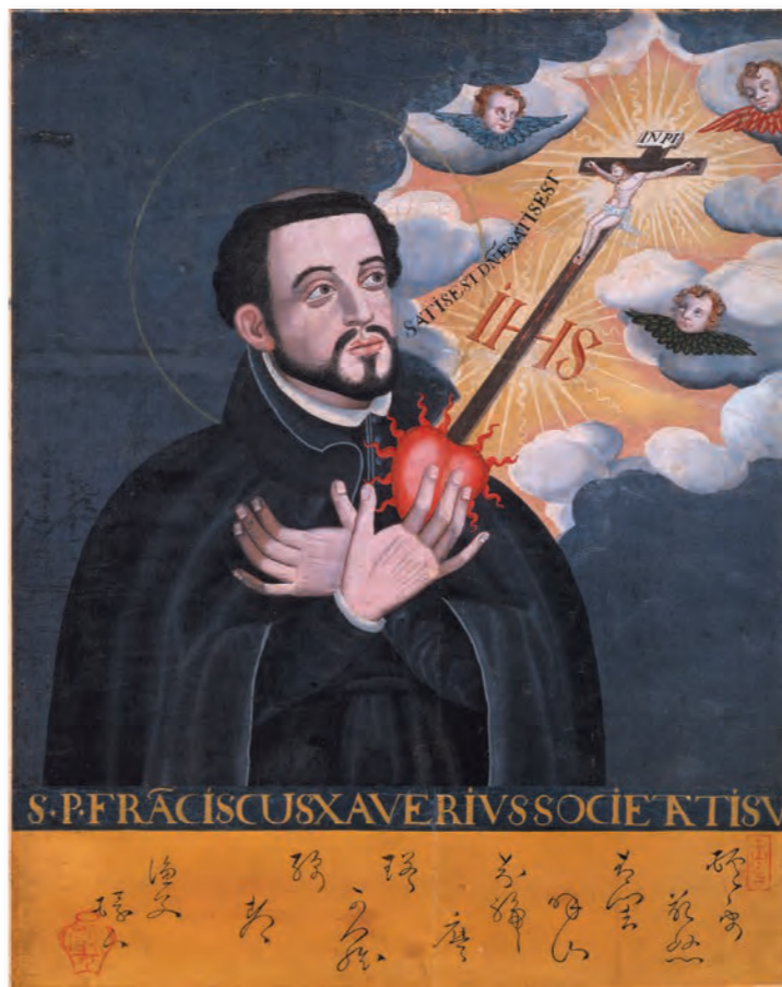
聖フランシスコ・ザビエル像 (神戸市立博物館所蔵) (国重要文化財)

上の絵には燃えるハートが描かれているが、他のザビエルの絵には見られない特徴的なモチーフ。「神へのあつい信仰心」を象徴している