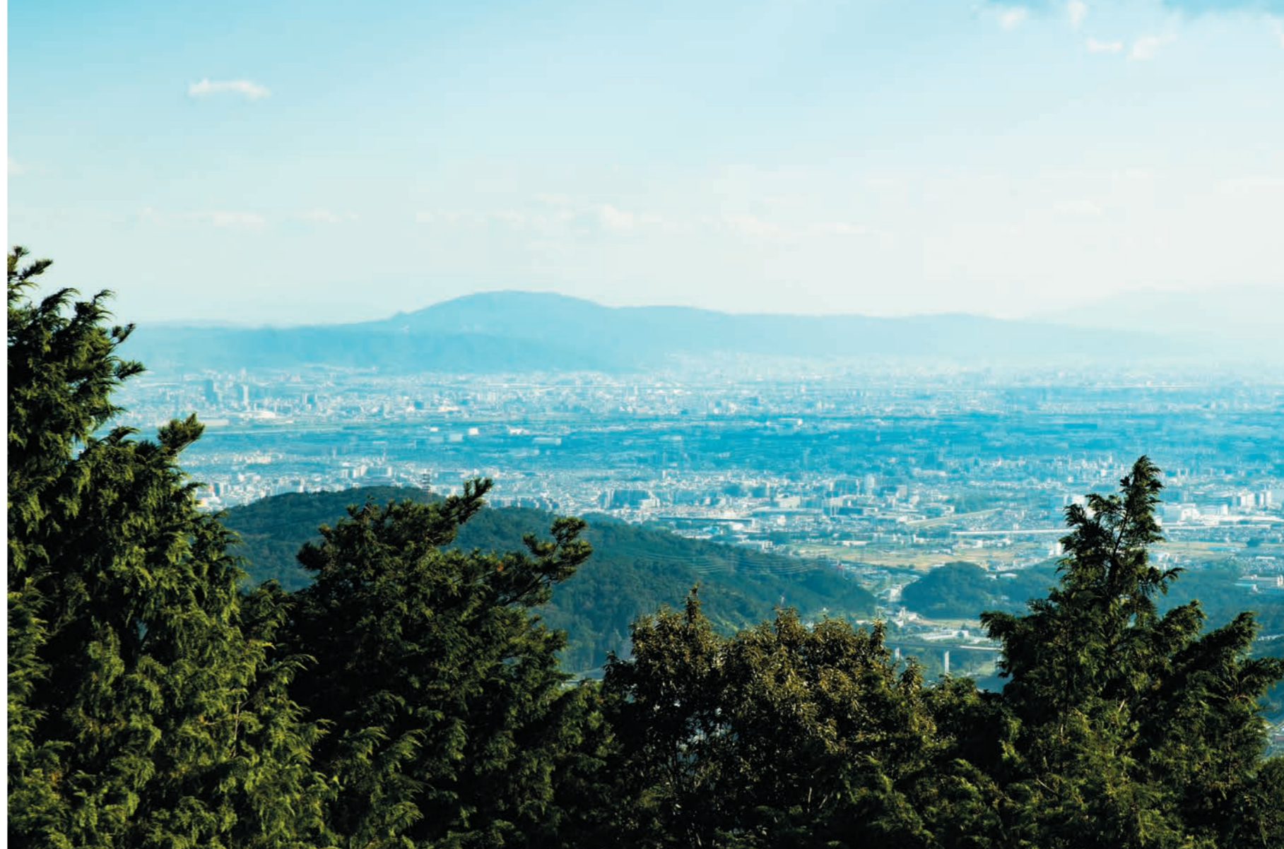
竜王山は標高510m。冬晴れの日には、頂上の展望台からはるか淡路島まで見渡せる