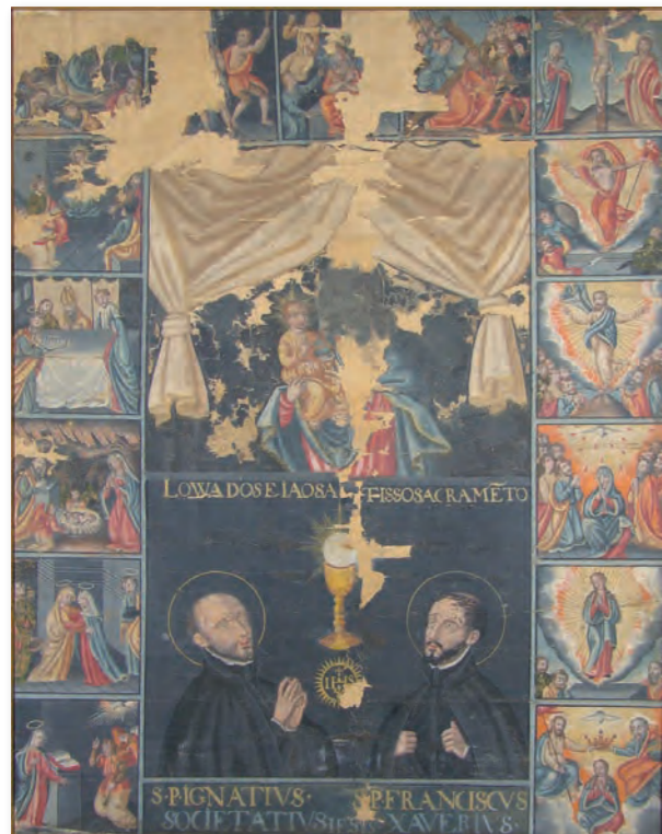
マリア十五玄義図(東家本) (府指定有形文化財)