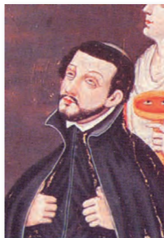
マリア十五玄義図(原田家本)一部 (京都大学総合博物館所蔵)