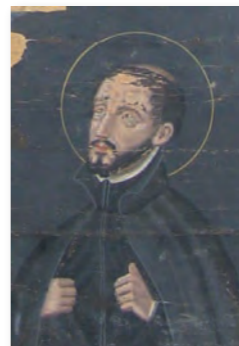
マリア十五玄義図(東家本)一部