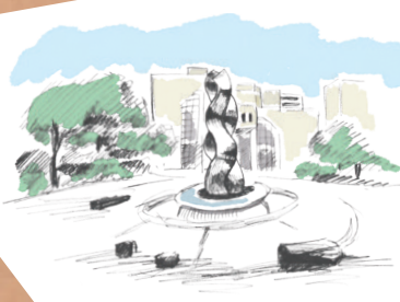
クリエイト センター前広場 (中央公園北側広場)