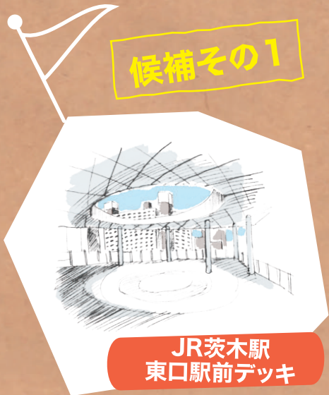
JR茨木駅 東口駅前デッキ