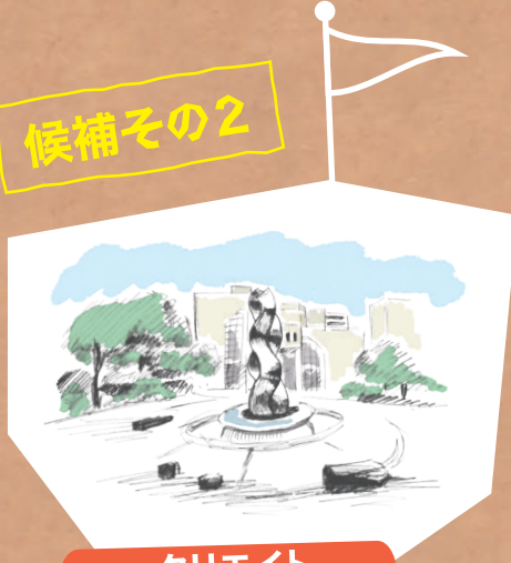
クリエイト センター前広場 (中央公園北側広場)