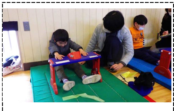
⑧写真タイトル：長座体前屈（子どもたちはスコアつけることにこだわります）