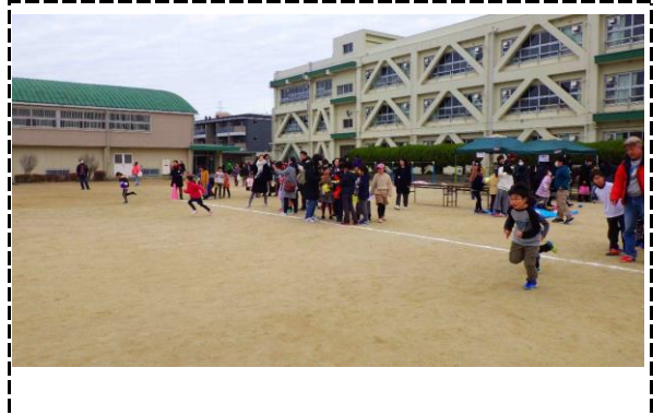
②写真タイトル：ターンランニング（約25m走ってターンして戻ってきます。）