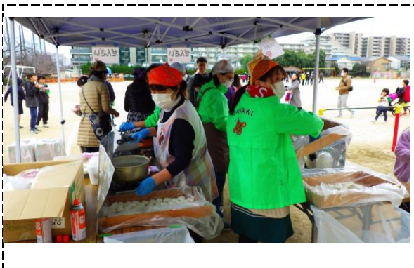
⑤写真タイトル：餅まるめ（青少年指導員もお手伝いしてもらってます）