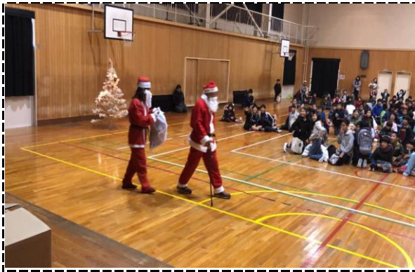
③写真タイトル: サンタさん登場