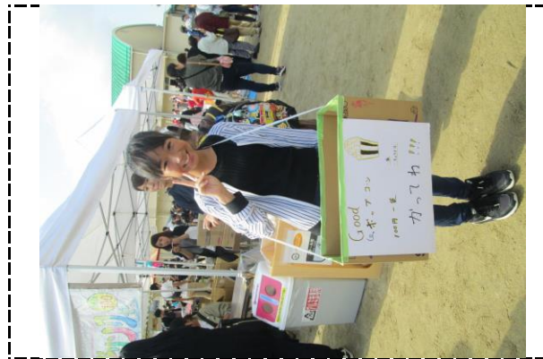
⑥写真タイトル:ポップコーン販売