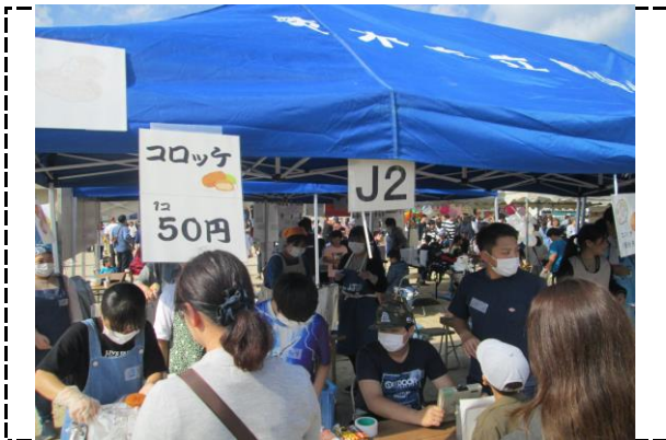
③写真タイトル:コロッケ屋