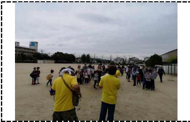
③写真タイトル：出発前の集合