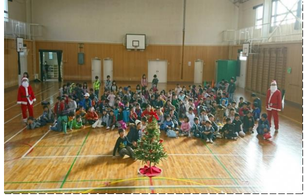
②写真タイトル: 全員集合