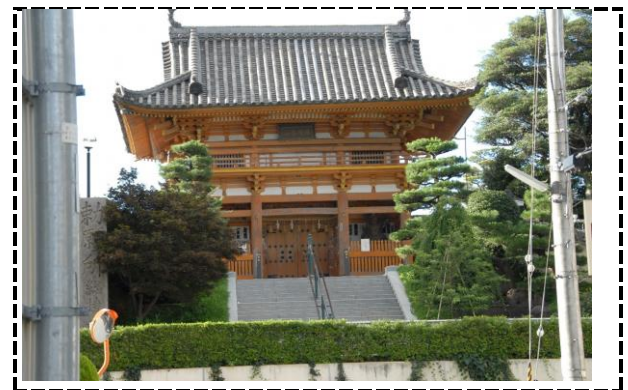
⑧写真タイトル：総持寺