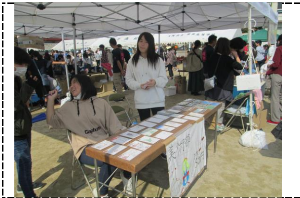
⑤写真タイトル:美術部/作品販売