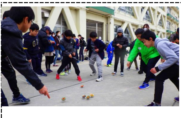
⑦写真タイトル：コマ回し（大人の方が真剣です）