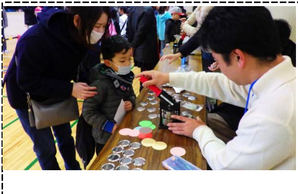
③写真タイトル：缶バッジ作成（これが目玉イベントです）