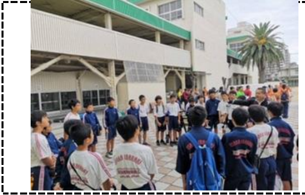
①写真タイトル：準備説明を受けている中学生

ほっとけん！アワード 団体名（ 東雲中学校区青少年指導員会 ） 行事名（東雲中学校区ふれあいウォーク ）