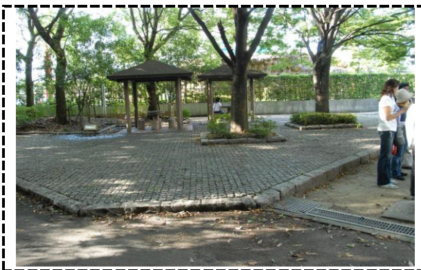
⑦写真タイトル：西河原公園出口