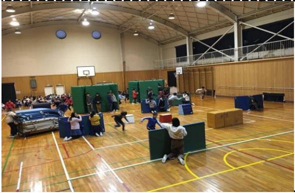
①写真タイトル: みんなでゲーム