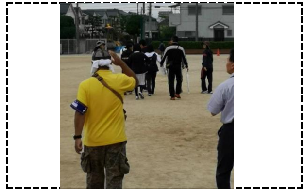
④写真タイトル：最後尾の出発