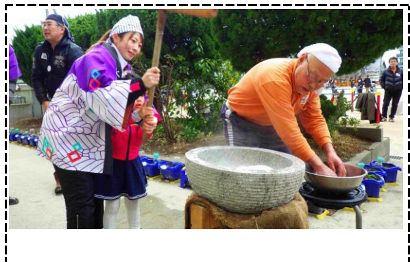
⑥写真タイトル：厄落としぜんざいのお餅つき