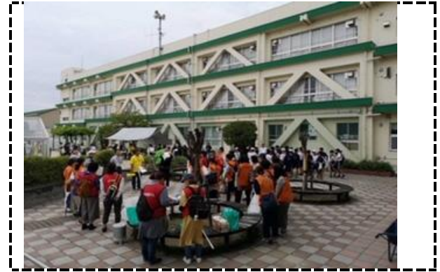
②写真タイトル：準備説明を受けているPTAの方々