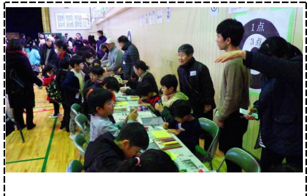
④写真タイトル：昔のおもちゃづくり（高齢者大学に先生をしてもらいます）