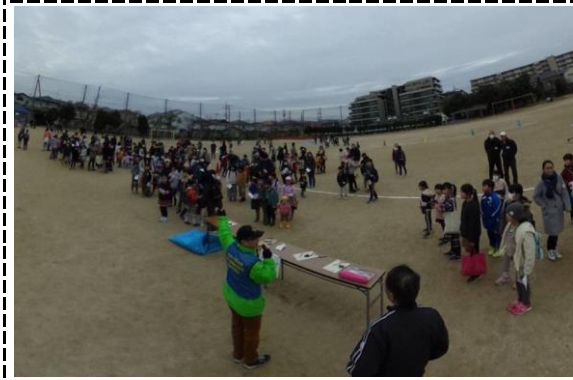
①写真タイトル：開会式の様子