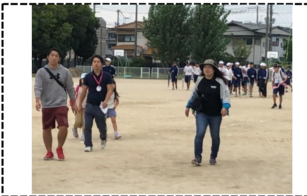
⑤写真タイトル：無事ゴール