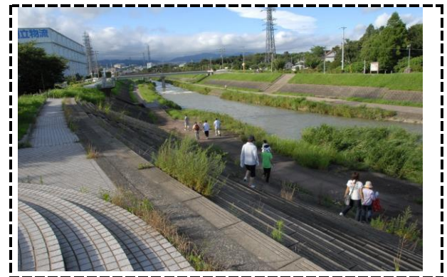
⑥写真タイトル：三角点