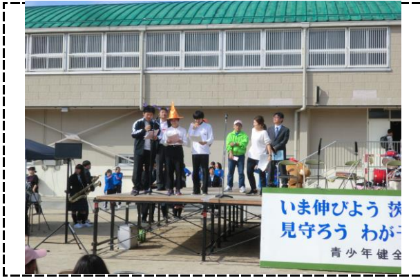
①写真タイトル:ステージ