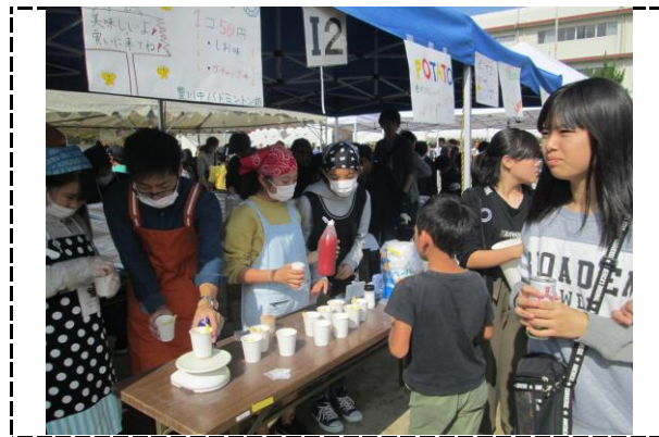
④写真タイトル:バドミントン部/フライドポテト販売