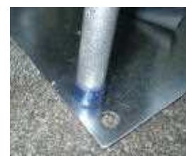
完全に差し込んだ状態