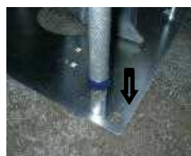
4本のソケットに脚を合わせて均等に押し込む

マンホールカバーの4ヶ所のソケットとフレームの脚を合わせて押し込みます。ソケットが緩んででいる(遊びがある)状態で差し込んでください。ソケットは左に回すと緩みます。