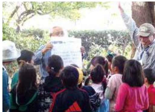
環境教育ボランティアによる環境講座