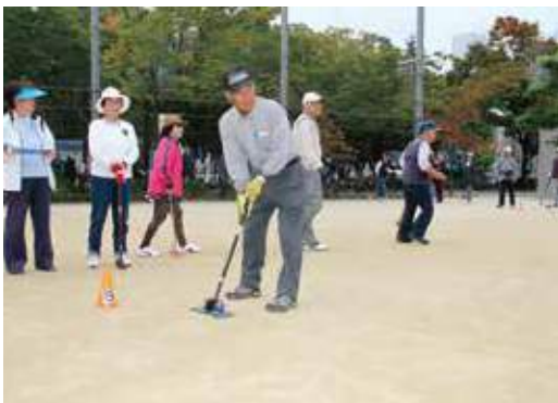
グラウンドゴルフの様子