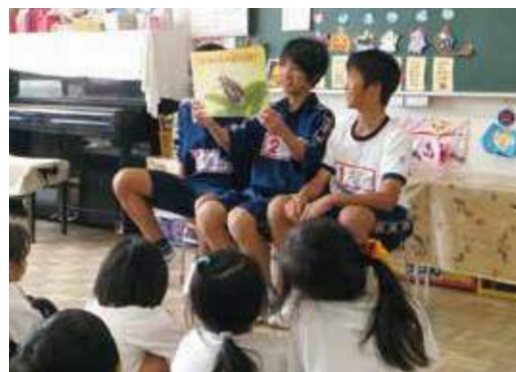
中学生の職業体験学習