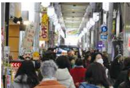
茨木阪急本通商店街