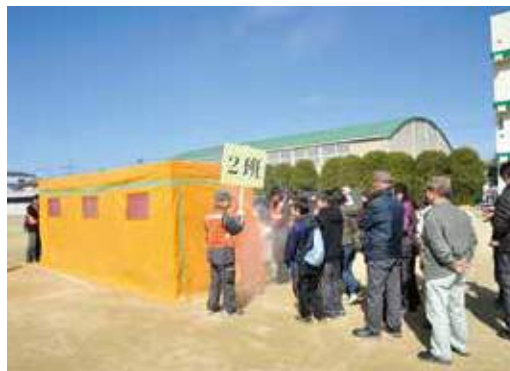
地域での防災訓練(煙体験訓練)