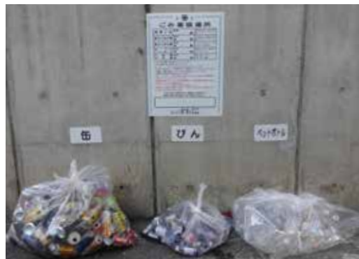
資源物分別の様子