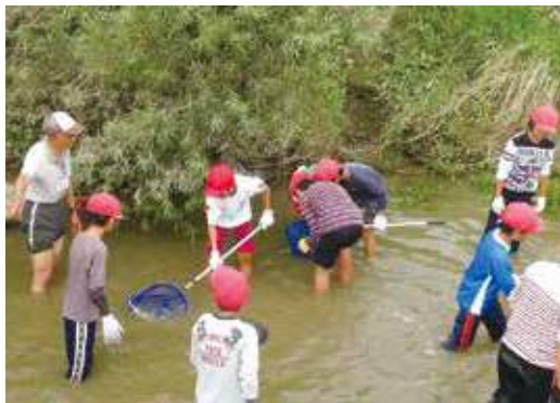
水辺の生きもの観察会

これらに資する積極的な環境配慮行動に取り組む市民や事業者を支援することで、あらゆる主体が協働し、生活環境、自然環境、低炭素、資源の循環を基盤とした、みんなで創る環境にやさしいまちをめざします。