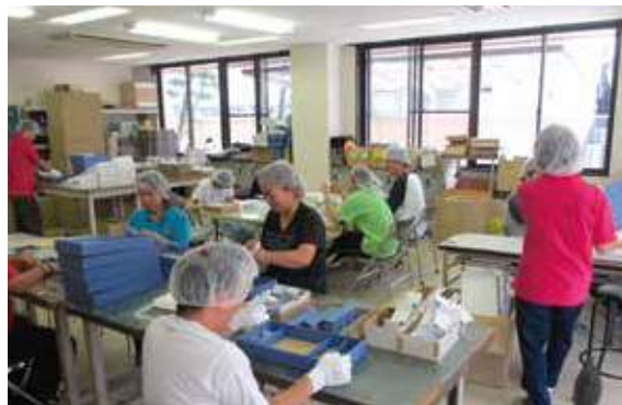
障害福祉サービス事業所における生産活動