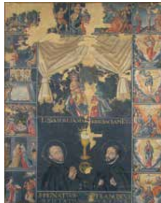
府有形文化財マリア十五玄義図 (文化財資料館保管)