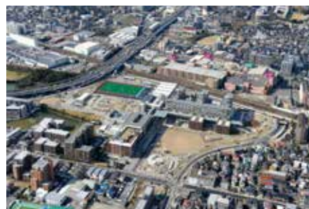
立命館大学大阪いばらきキャンパス