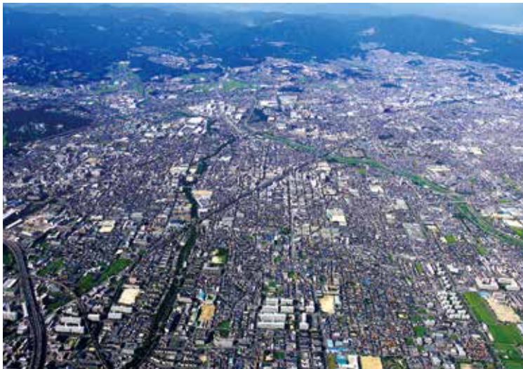
上空から見た茨木市

さらに、本市の玄関口となるJR茨木駅、阪急茨木市駅周辺の市中心部の再整備を進めるとともに、人口減少社会を迎えたわが国において顕在化しつつある諸課題（空き家対策、共同住宅の建て替え、公共・公益施設の維持など）に取り組みます。