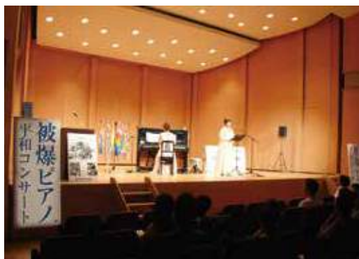
非核平和都市宣言30周年記念被爆ピアノコンサート

また、基本構想のスローガンである“ほっといばらき もっと、ずっと”の実現をめざし、人口減少社会を視野に入れながら本市の持つ魅力を積極的に市内外に発信します。