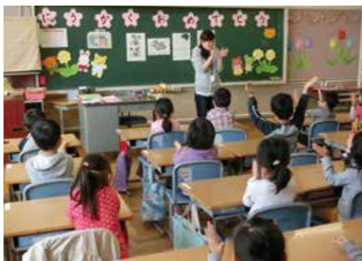
小学校での授業の様子