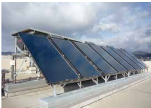
消防署西河原分署に設置した太陽熱温水器